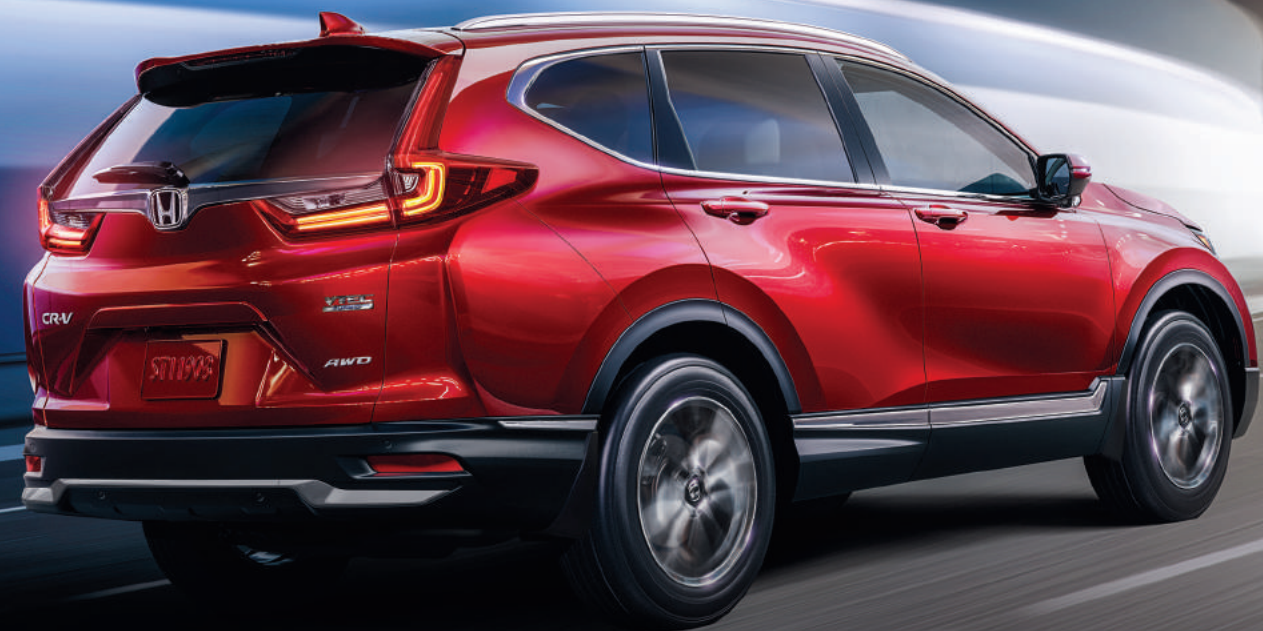
CR-V mostrada en: Radiant Red Metallic | CR-V shown in: Radiant Red Metallic

Even the most attentive of drivers can miss things. That's why we've equipped the CR-V with Honda Sensing, a full suite of safety and driver-assistive technologies designed to assist and help protect you and your passengers.