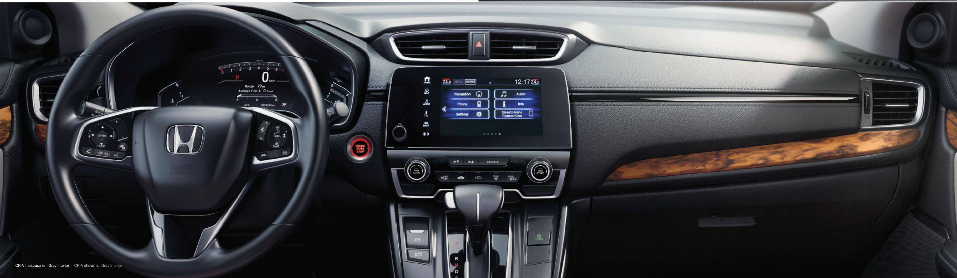
CR-V mostrada en: Gray Interior | CR-V shown in: Gray Interior