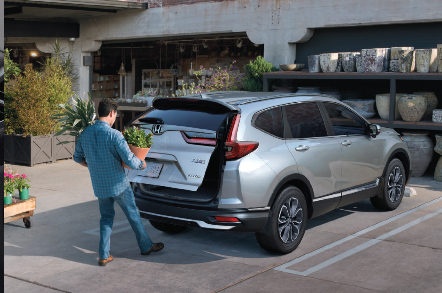
CR-V mostrada en: Lunar Silver Metallic | CR-V shown in: Lunar Silver Metallic