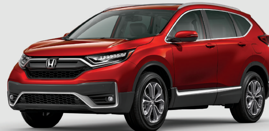
CR-V mostrada en: Molten Lava Red Pearl | CR-V shown in: Molten Lava Red Pearl