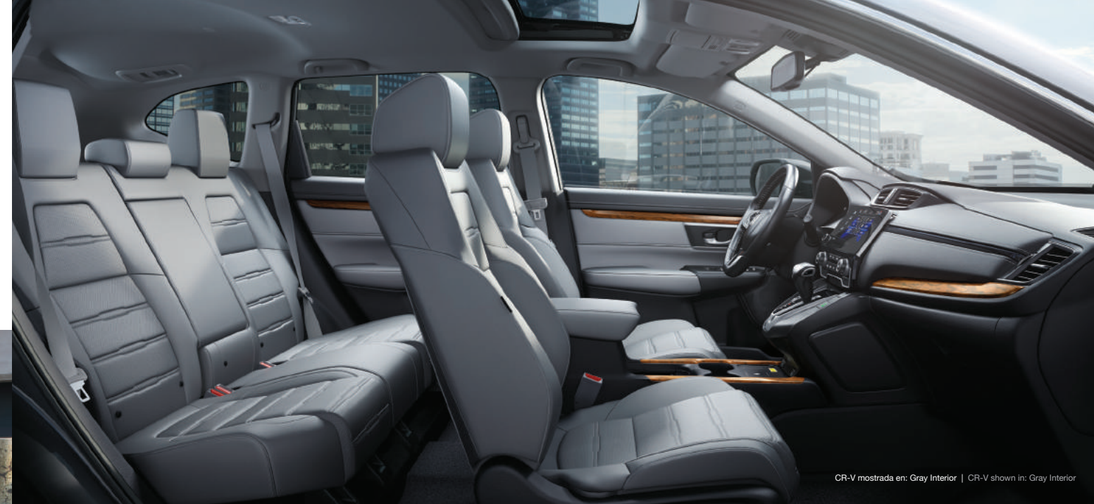
CR-V mostrada en: Gray Interior | CR-V shown in: Gray Interior

La rediseñada CR-V ofrece más comodidad y conveniencia que nunca, desde un interior de cuero hasta una puerta trasera eléctrica (EX-L). La filosofía de Honda es ofrecer siempre un mejor diseño. The redesigned CR-V delivers more comfort and convenience than ever, from an available leather-trimmed interior to a power tailgate (EX-L). Because design that enhances is the Honda way.