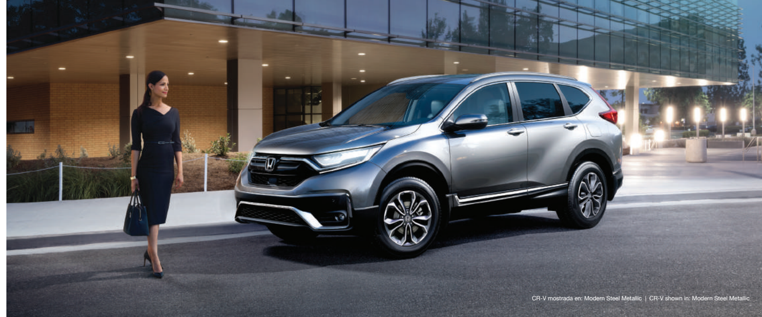
CR-V mostrada en: Modern Steel Metallic | CR-V shown in: Modern Steel Metallic

The vehicle that defined a category now redefines what a compact sport-utility vehicle can be. Introducing the redesigned Honda CR-V: delivering a wealth of standard features and driver and passenger conveniences. Welcome to the style, elegance and versatility of the Honda CR-V.